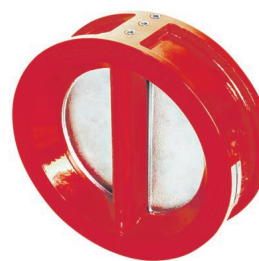
ТИП 010C RED DN 50-300

Фланцевый затвор для систем пожаротушения. Корпус окрашен в красный цвет