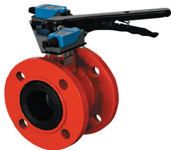
ТИП 021F RED DN 50-300

Задвижка клиновая фланцевая под электропривод для систем пожаротушения. Корпус окрашен в красный цвет