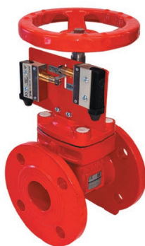
ТИП 47GV RED DN 50-300

Межфланцевый затвор для систем пожаротушения. Корпус окрашен в красный цвет