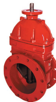
ТИП 47GVA RED DN 50-300

Задвижка клиновая фланцевая для систем пожаротушения. Корпус окрашен в красный цвет