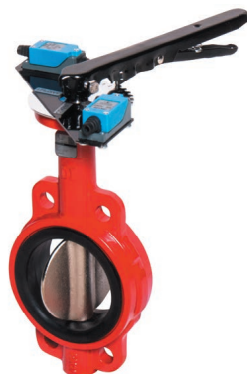
ТИП 017W RED DN 50-300

Межфланцевый затвор для систем пожаротушения. Корпус окрашен в красный цвет